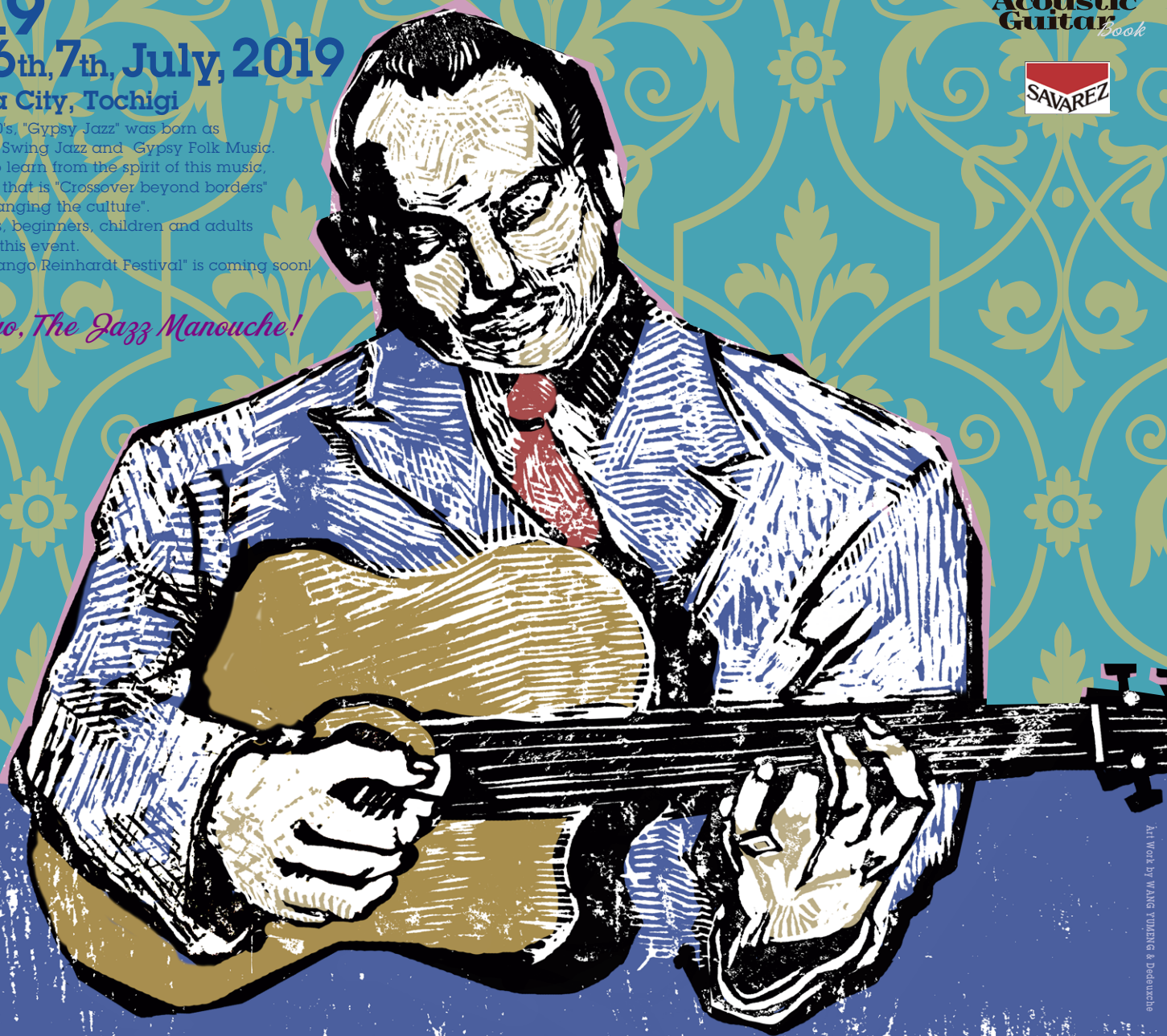
Art Work by WANG YUENGG & Dedouchie

さすらうジプシーのメロディとJazzのランデヴー。ヨーロッパを揺らしたジプシー・ジャズは懐かしく熱く、なんだかお洒落!